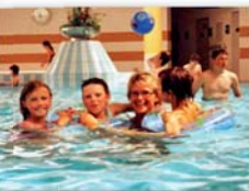
Badespaß auf Sylt