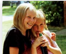
Stunden der Zufriedenheit