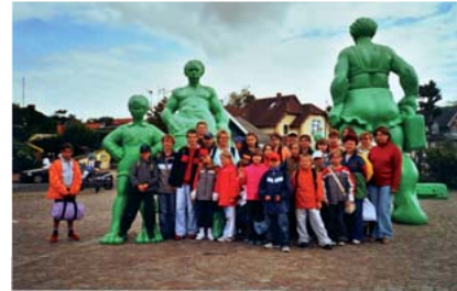
Kindergruppe 2006 auf Sylt

VR Bank eG, Niebüll Konto 25 16 16 14 (BLZ 31763542)