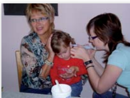
Anfertigung eines Ohrabdruckes.